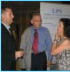
Man trifft sich