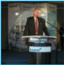
Landrat Dieter Patt