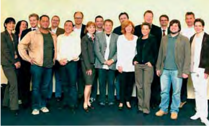
Initiativkreis Kaarst Total

Kaarst Total geht am 05. und 06. September in die elfte Auflage. Im Focus steht in diesem Jahr das zehnjährige Bühnenjubiläum der Hügenbühne an der Matthias-Claudius-Straße. Die Macher von Kaarst Total im gleichnamigen Initiativkreis sind schon seit Monaten an der Arbeit, den bisherigen 10 Ausgaben des "schönsten Stadtfestes am Niederrhein" noch einen "drauf" zu setzen. Dafür wurde der Initiativkreis noch um weitere sieben Mitglie-