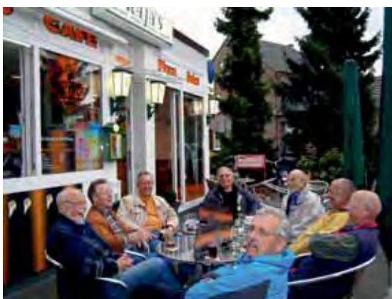
Ein geselliges Erfrischungsbierchen nach der Radtour