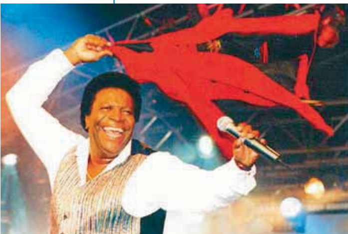
Stimmungskanone Roberto Blanco