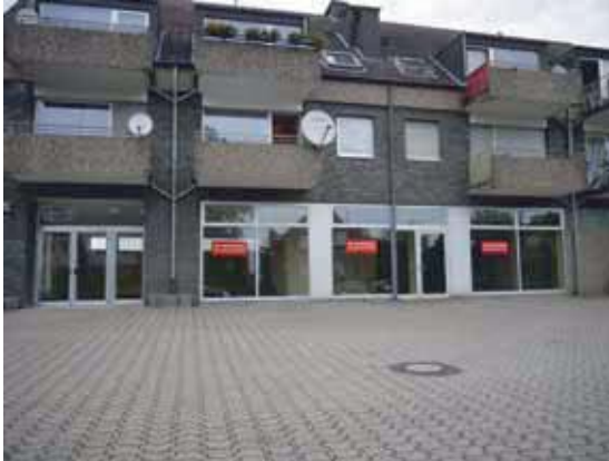
Ehemals Schlecker Antoniusstraße Vorst

Kaarst ist ein gefragter und erfolgreicher Standort für wirtschaftliche Aktivitäten. Die Zahl der Unternehmen und die Anzahl der Arbeitsplätze haben in den letzten 10 Jahren kontinuierlich zugenommen. Die Arbeitslosenquote hat sich in den letzten 15 Jahren halbiert und das Gewerbesteuer-aufkommen nahezu verdreifacht. Kaarst hat sich insbesondere aufgrund der Top-Lage und der hervorragenden Verkehrsanbindung zu einem gefragten Wirtschaftsstandort mitten in der Ballungszone Düsseldorf-Krefeld-Mönchengladbach entwickelt.