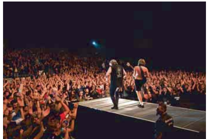
Europas beste AC/DC Coverband: Barock

Shoppen und Flanieren stehen ebenfalls im Mittelpunkt von Kaarst Total, denn über 120 Fachgeschäfte