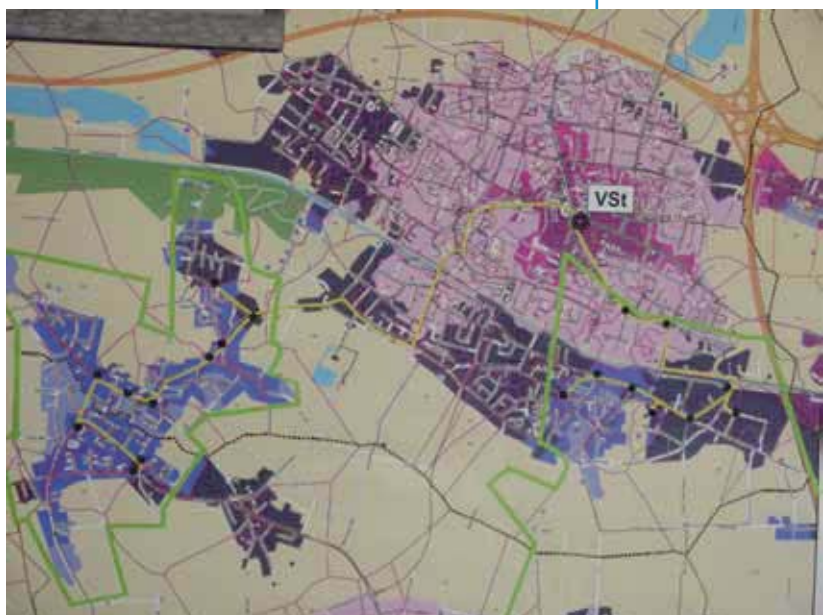
gelbe Linie: zukünftige Glasfasertrasse schwarze Punkte: Outdoor-dslams (Unterverteiler) grüne Umgrenzungsline: Ausbaubereiche

Die Internetgeschwindigkeit hängt davon ab, wie nah jemand am nächsten Knotenpunkt wohnt. Denn die herkömmliche Telefonleitung aus Kupfer, über die der Datenstrom geschickt wird, dämpft das Signal Meter um Meter. Ab einer Entfernung von rund fünf Kilometern kommt auch das stärkste Signal nicht mehr an. Um Kaarst mit schnellem Internet zu versorgen, wird die Telekom 19 nähere Knotenpunkte aufbauen und acht Kilometer Glasfaserkabel neu verlegen