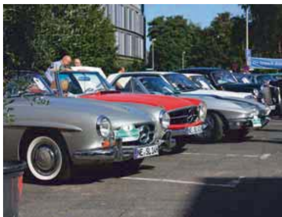
13. Oldtimertreffen mit Orientierungsfahrt

in der Innenstadt warten beim XXL-Shopping-Weekend mit tollen Stadtfestangeboten auf die vielen Kunden aus der ganzen Region. Insbesondere am Sonntag öffnen die Geschäfte von 13 bis 18 Uhr und werden beweisen, dass man in Kaarst besonders gut einkaufen kann.