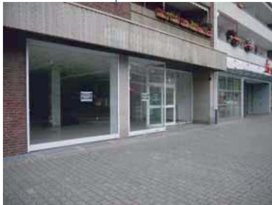
Ehemals Schlecker Maubisstraße Kaarst

Kaarst ist ein gefragter und erfolgreicher Standort für wirtschaftliche Aktivitäten. Die Zahl der Unternehmen und die Anzahl der Arbeitsplätze haben in den letzten 10 Jahren kontinuierlich zugenommen. Die Arbeitslosenquote hat sich in den letzten 15 Jahren halbiert und das Gewerbesteuer-aufkommen nahezu verdreifacht. Kaarst hat sich insbesondere aufgrund der Top-Lage und der hervorragenden Verkehrsanbindung zu einem gefragten Wirtschaftsstandort mitten in der Ballungszone Düsseldorf-Krefeld-Mönchengladbach entwickelt.