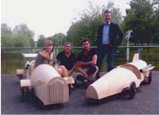
In vier Boxengassen werden auf der Handwerker Meile acht verschiedene Teams Seifenkisten bauen.

Auf der Handwerkermeile bei Kaarst-Total wird sich in diesem Jahr alles rund um Seifenkisten drehen. In vier Boxengassen werden hier acht verschiedene Teams Samstag und Sonntag Seifenkisten, gesponsort vom autohaus adelbert moll, bauen. Unter der fachlichen Anleitung der Tischlerei Hermans wird dies sicherlich jedem gelingen. Nach