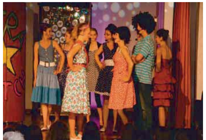
Musical Revue – Zauberhafte Reise durch die Welt der Musicals