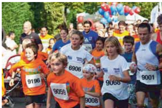
Starke Beteiligung beim Kaarst Total-Lauf

in der Innenstadt warten beim XXL-Shopping-Weekend mit tollen Stadtfestangeboten auf die vielen Kunden aus der ganzen Region. Insbesondere am Sonntag öffnen die Geschäfte von 13 bis 18 Uhr und werden beweisen, dass man in Kaarst besonders gut einkaufen kann.