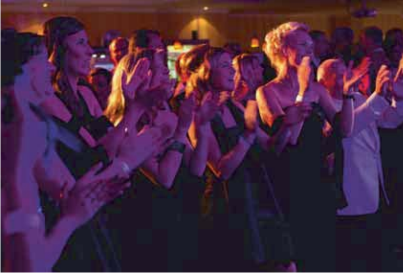
Stimmungsvoller Auftakt beim Gala-Abend

Wer Kaarst Total besucht, kann sich neben den vier Großbühnen und den über 100 Stunden Programm auf jede Menge Aktionen in der ganzen City freuen.