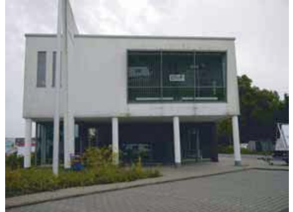
Ehemals T-Punkt Business Gustav-Heinemann-Straße