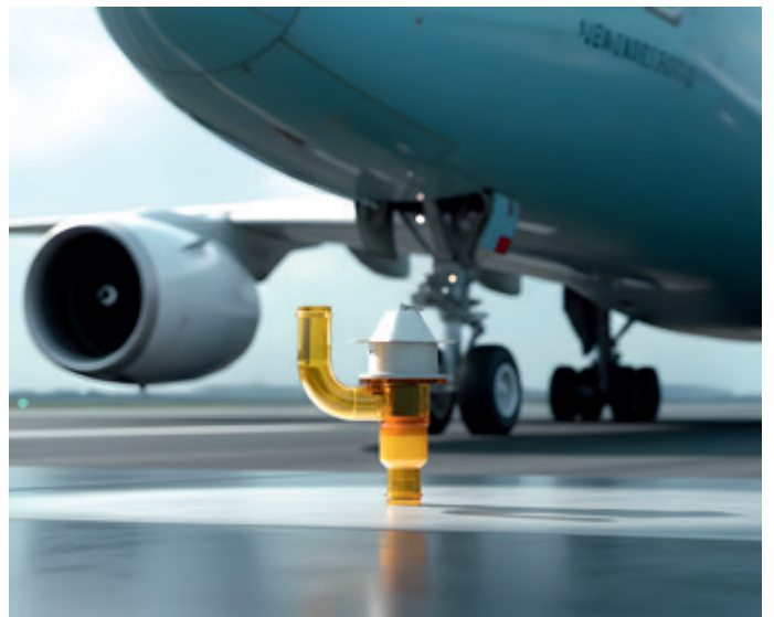
...zum KI Mockup im Produktkontext.