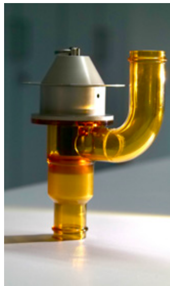
...über das reale Prototypenbild...