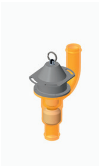
Vom CAD Rendering...

KI-Bilder Made in Kaarst entstehen so von der ersten Idee bis zum Social Media Post. ◆